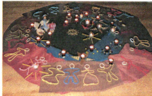
Das Volk, das im Dunkeln geht, schaut ein helles Licht