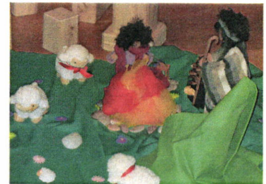
Mit den Hirten und Schafen am Feuer