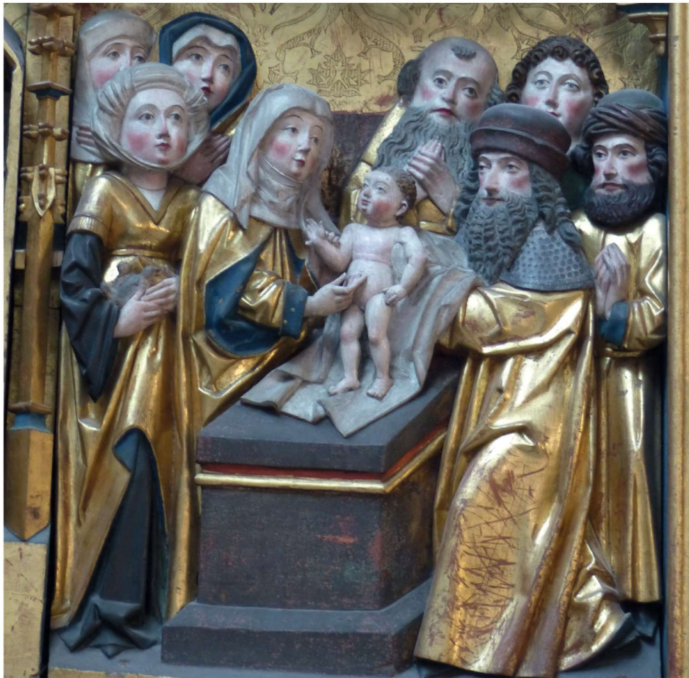
(Darstellung des Herrn, Liebfrauenkirche, Arnstadt)